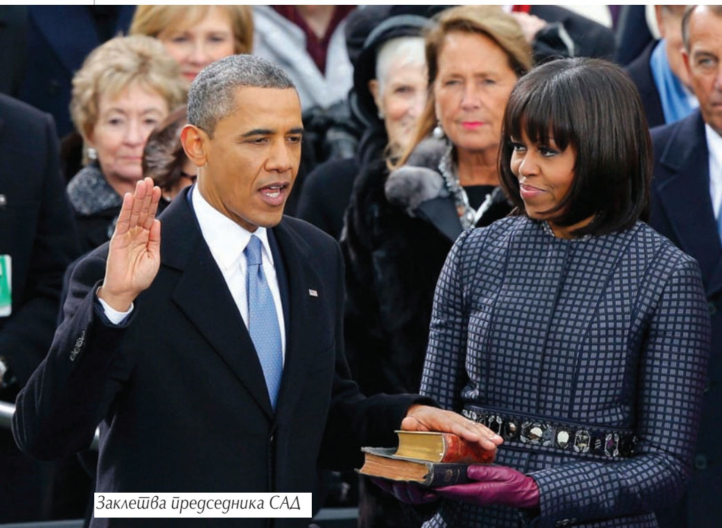
Заклетва председника САД

нисањем из јавног живота, постепено прераста у такозвани менаџментски лаицизам.